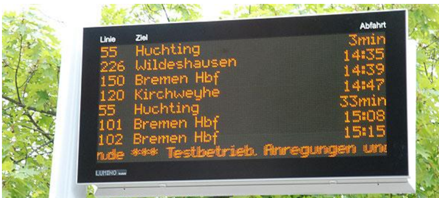
elektronische Anzeigetafel am ZOB Brinkum

Echtzeitdaten bedeuten für den Fahrgast, dass eventuelle Verspätungen der Busse sofort auf elektronischen Anzeigetafeln z.B. am ZOB Brinkum (siehe Foto), im Internet ( www.vbn.de und www.fahrplaner.de ) oder auf einem Smartphone-Handy (iPhone und Android) mit der VBN-App jederzeit und an jedem Ort angezeigt werden. Auf allen anderen „normalen“ Handys sind diese Echtzeitdaten mittels des Internetbrowsers unter m.vbn.de abrufbar.